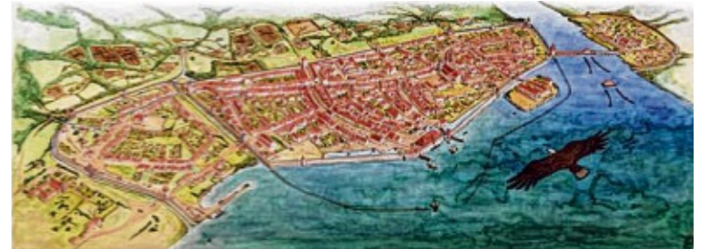
Die Buchillustrationen von Ralf Staiger lassen das Konstanz zur Zeit des Konzils lebendig werden.